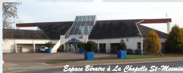
Espace Béraire à La Chapelle St-Mesmin